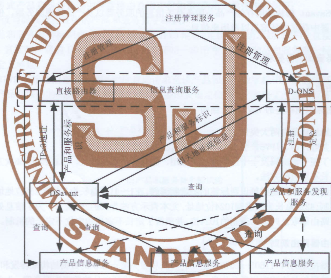
图 1 射频识别标签查询与发现服务的网络架构图

基于IPV9协议和DDNS的网络架构是十进制网络架构。包含两种方式：一是采用路由直接定位信息服务，路由采用IPV9协议，无需DNS 解析程序；二是采用应用层的解析服务，则需DDNS解析服务器，（参见RFC 1034 、RFC 1035、SJ/T11271-2002）其中DONS采用主机域名解析提供IPV4、IPV6、IPV9地址，路由采用IPV4、IPV6 、IPV9等协议，资源定位由DDNS完成。第二种方式是支持多栈的十进制网络的解决方案，通过D-ONS和DDNS实现十进制网络在IPV4、IPV6、IPV9等协议下的电子标签查询定位。如图1所示。